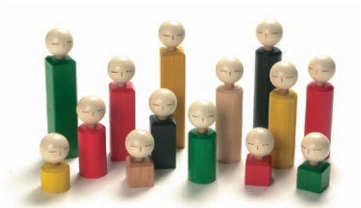
802 Holzfiguren Set (40 Stk.)